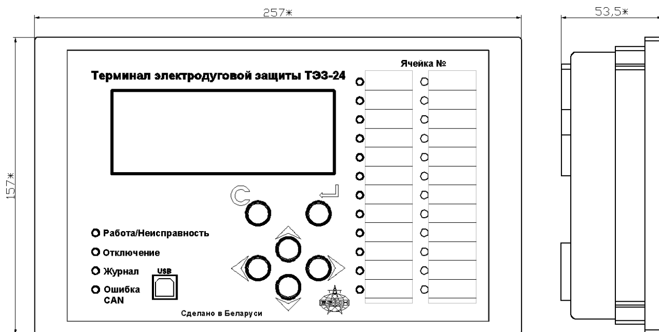
Рисунок А.1 – Габаритные размеры ТЭЗ-24